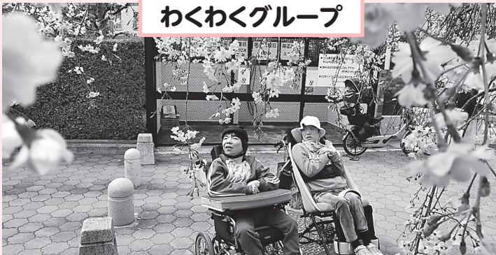
わくわくグループ

デイサービスセンターの隣には、昆陽池公園がありま す。今年も毎年恒例のお花 見に3グループそれぞれお出 かけしました。