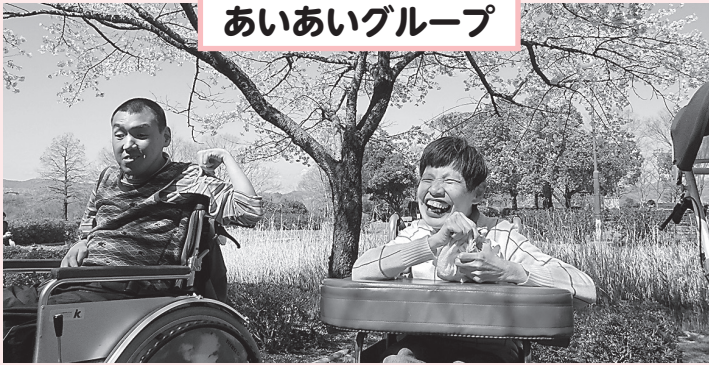
あいあいグループ