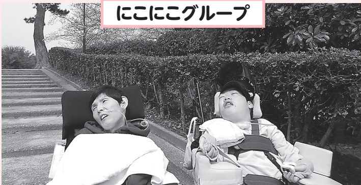
にこにこグループ

デイサービス利用者のみな さまは、とても良い表情で桜 を鑑賞されました、そのとき の様子を写真とともにご覧 ください。