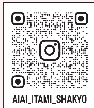
↑ Instagram QRコード ↑